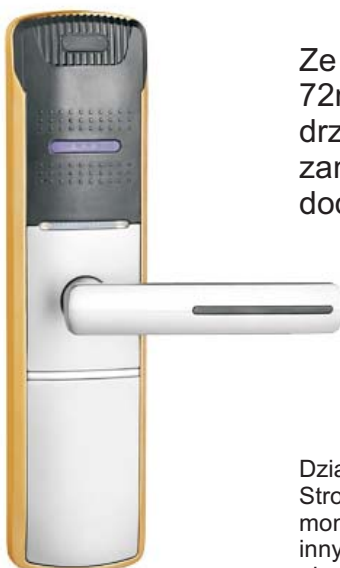
EZH-918 SRLP (ZBP)

Ze względu na europejskie wymiary wkładki (rozstaw klamka-wkładka = 72mm), model ten polecany jest do montowania w istniejących drzwiach. Instalacja polega na wymianie wkładki oraz szyldu starego zamka. Bateryjne zasilanie zamka (tzw. tryb OFF-LINE) nie wymaga dodatkowej instalacji elektrycznej co bardzo upraszcza montaż.