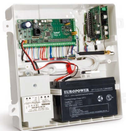
Przykładowa konfiguracja sprzętu do obudowy OPU-4 PW