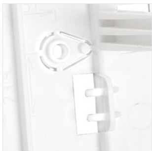
Miejsce na styk sabotażowy reagujący na oderwanie od podłoża